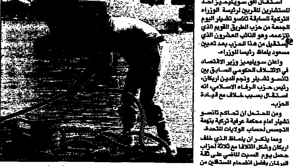
سفينة حربية تركية تزور قبرص (ديتر)

انقرة - من عائشة ارغلو، استقال الفق سويليميز احد المستشارين المقربين للرئيس التركي السابق تانسو تشيلر اليوم الجمعة من حزب الطريق القويم الذي تأسس تشيلر ونجم الدين اريكان، رئيس حزب الرفاه الاسلامي، أنه استقال بسبب خلاف مع قيادة الحزب.